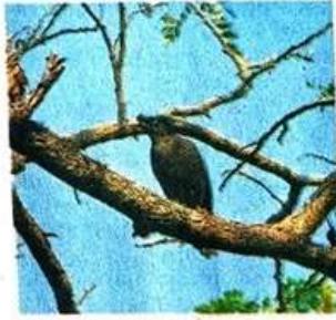
Bird species found at St Aloysius