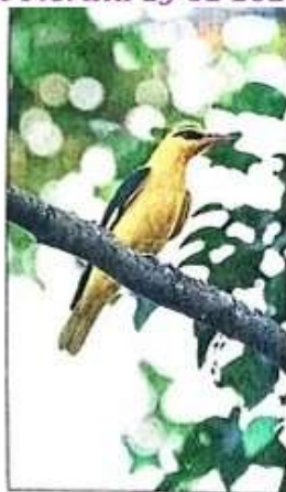
Some of the bird species recorded on the campus included Jungle Myna and Indian Golden Oriole.