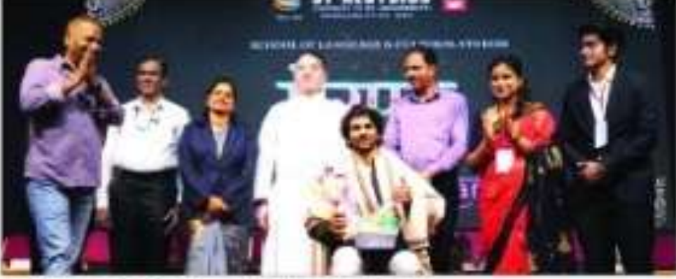
ಅಲೋಶಿಯಸ್‌ನಲ್ಲಿ ಹಿಂದಿ ಸಾಂಸ್ಕೃತಿಕ ಉತ್ಸವ ನಡೆಯಿತು.

ಮಂಗಳೂರು: ಸಂತ ಅಲೋಶಿಯಸ್ ಪರಿಗಣಿತ ವಿತ್ತವಿದ್ಯಾನಿಲಯದ ಭಾಷಾ ಮತ್ತು ಸಾಂಸ್ಕೃತಿಕ ಅಧ್ಯಯನ ಶಾಲೆಯ ಹಿಂದಿ ವಿಭಾಗ ಮತ್ತು ಹಿಂದಿ ಸಂಘವು 'ದೇಸಿ ಕಲಾಕರ್' ಎಂಬ ವಿಷಯದ ಮೇಲೆ ಹಿಂದಿ ಸಾಂಸ್ಕೃತಿಕ ಉತ್ಸವ 'ಪ್ರೇರಣಾ- 2026'ನು ಫೆ.18ರಂದು ಕ್ಯಾಂಪಸ್‌ನಲ್ಲಿ ಆಯೋಜಿಸಿತ್ತು.