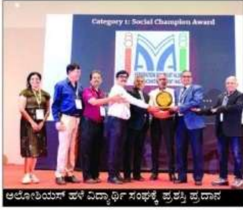
ಅಲೋಶಿಯಸ್ ಹಳೆ ವಿದ್ಯಾರ್ಥಿ ಸಂಘಕ್ಕೆ ಪ್ರಶಸ್ತಿ ಪ್ರದಾನ