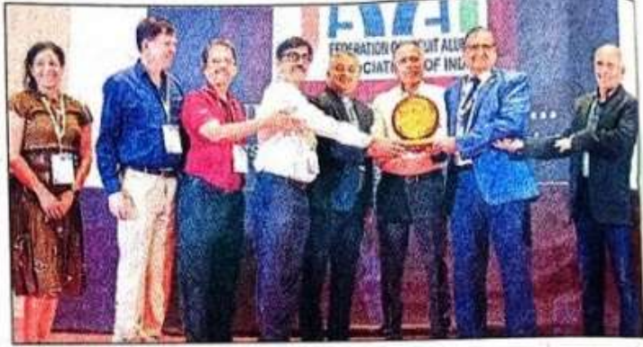
ಗೋವಾದಲ್ಲಿ ನಡೆದ ಕಾರ್ಯಕ್ರಮದಲ್ಲಿ ಮಂಗಳೂರಿನ ಸೇಂಟ್ ಅಲೋಶಿಯಸ್ ಕಾಲೇಜಿನ ಹಳೆಯ ವಿದ್ಯಾರ್ಥಿಗಳ ಸಂಘವು, 'ಸಾಮಾಜಿಕ ಚಾಂಪಿಯನ್ಸ್ ಪ್ರಶಸ್ತಿ' ಪಡೆದುಕೊಂಡಿತು

2023ರಿಂದ ಜೂನ್ 2025ರ ಅವಧಿಯಲ್ಲಿ ಮಂಗಳೂರು ಜಿಲ್ಲಾ ಕಾರಾಗೃಹದಲ್ಲಿ ಅಲೋಶಿಯಸ್ ಸಂಸ್ಥೆಯು ಜಿಲ್ಲಾ ಕಾನೂನು ಸೇವೆಗಳ ಪ್ರಾಧಿಕಾರದ ಸಹಯೋಗದಲ್ಲಿ ಕೈದಿಗಳ ಮನಃ ಪರಿವರ್ತನೆಗಾಗಿ ಆಯೋಜಿಸಿದ್ದ ಸಂಪರ್ಕ ಕಾರ್ಯಕ್ರಮಗಳನ್ನು ಗುರುತಿಸಿ ಈ ಪ್ರಶಸ್ತಿ ನೀಡಲಾಗಿದೆ.