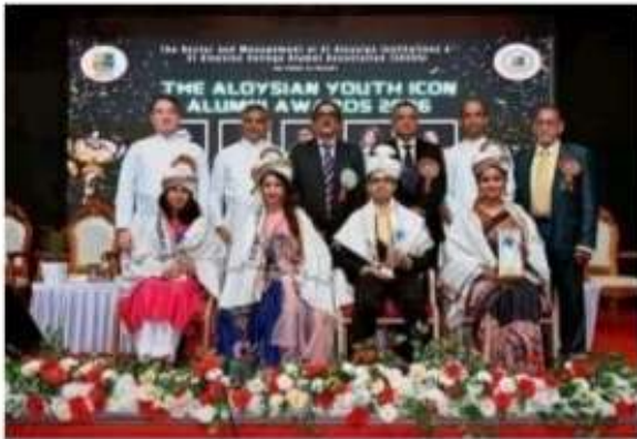
St. Aloysius College Alumni Association presented the Aloysian Youth Icon award – 2026 to five persons recently.